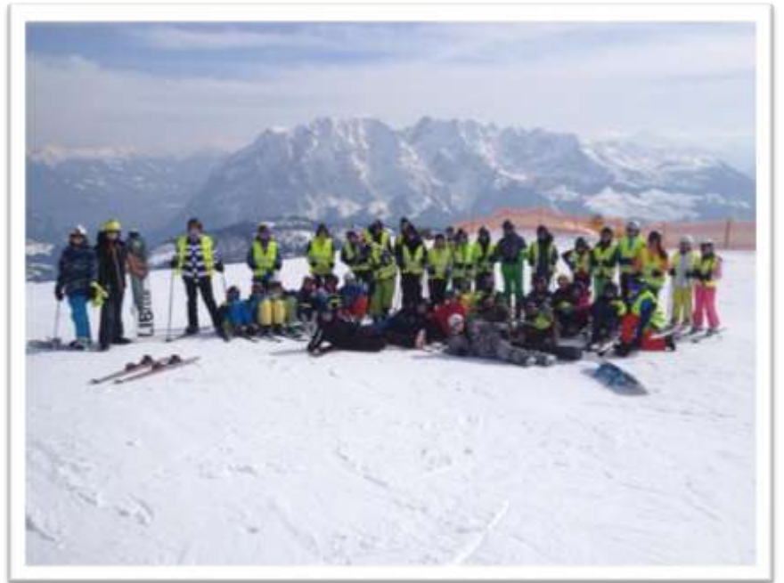
Rozhovor vedl a zapsal Vojtěch Scheicher 7.C

MH: Mohlo to být lepší, ale jinak dobrý.